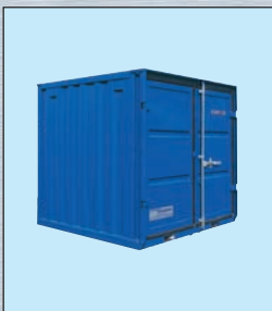
Typ LC 6'