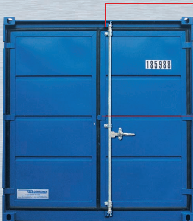
Lagercontainer mit Sicherheitspaket