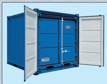
LC-Set Beispiel (LC 10' + 8')