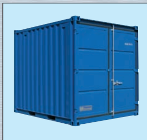
Typ LC 10'