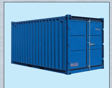
Typ LC 15'