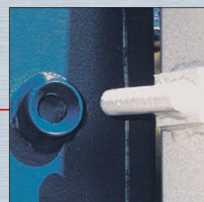
4 innenliegende Aushebesicherungen