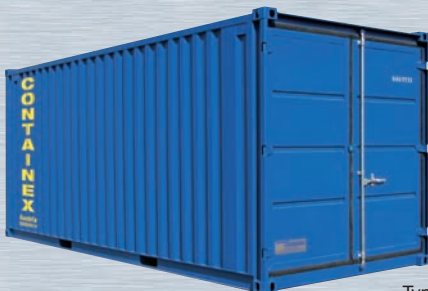
Typ LC 20'

CTX-Lagercontainer mit Sicherheitspaket sind in verschiedenen Größen und vielen Ausstattungsvarianten verfügbar.